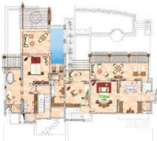
Beachfront Pool Suite