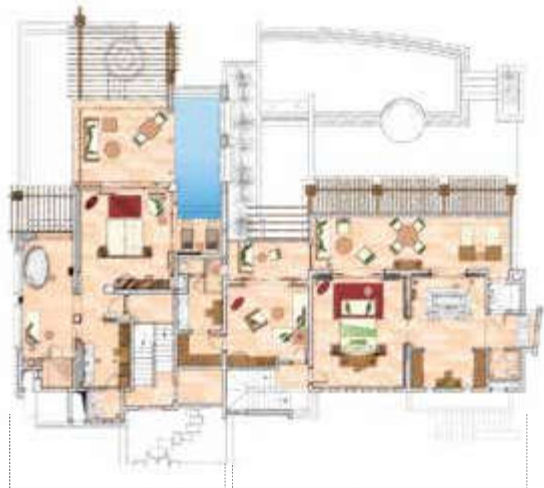
Oceanfront Pool Suite